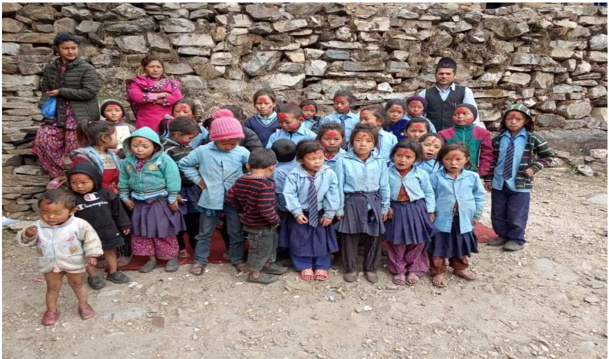
रातो टिकामा मरुखै ! धादिङ जिल्लाको सबैभन्दा दूरदराजमा रहेको हिन्दुङ आ.वि.का विद्यार्थीहरु साथमा शिक्षक शिक्षिकाहरु