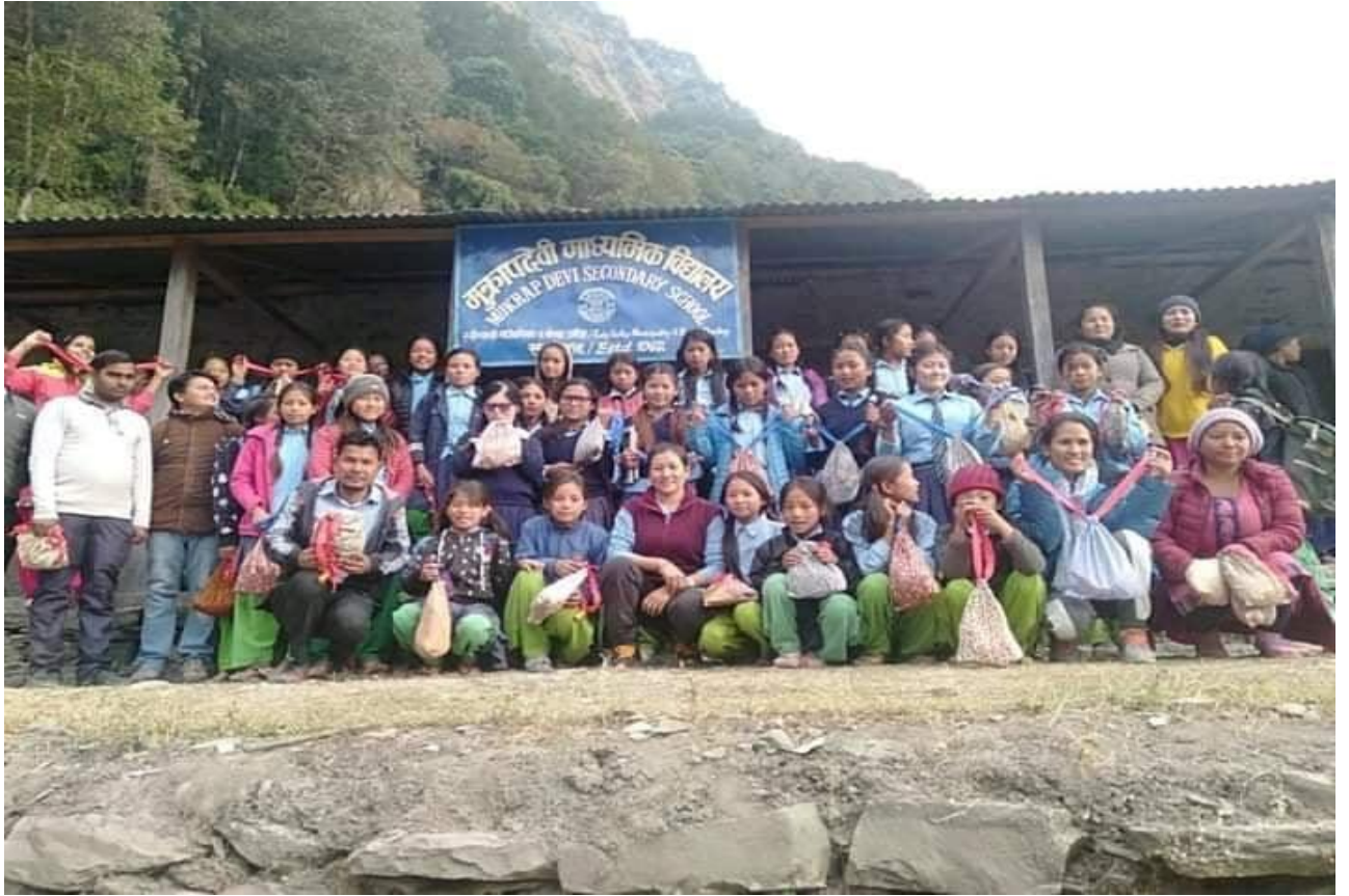
रुबी भ्याली गा.पा.को सबैभन्दा पुरानो शैक्षिक संस्थाको रूपमा रहेको श्री मुत्राप देवी मा.वि. रुबीभ्याली-४, धादिङ ।