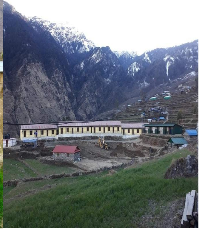
↑ रुबी भ्याली गा.पा. वडा नं. १, तिप्लिङ स्थित दोङ्देन देवी मा.वि. ↑ २०७२ सालको भूकम्प पहिलाको अवस्था र त्यस पछिको नयाँ संरचना खडा भए पछिको अवस्था